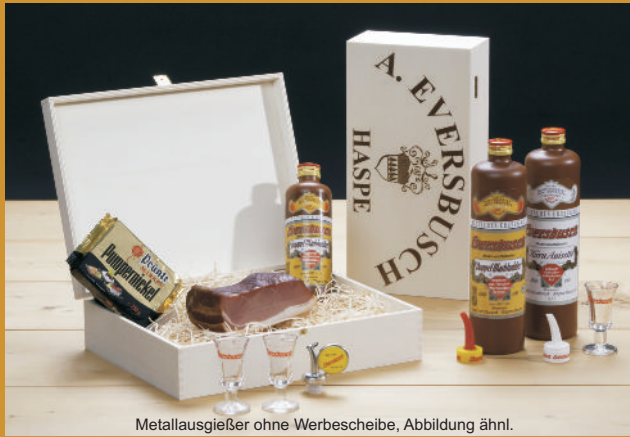
Metallausgießer ohne Werbescheibe, Abbildung ähnl.