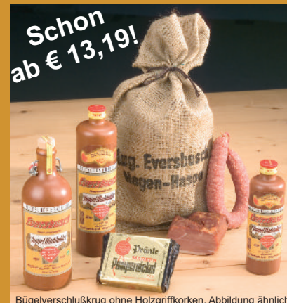
Bügelverschlusskrug ohne Holzgriffkorken, Abbildung ähnlich

traditionelle Erlebnis in geselliger Runde. Auf Wunsch gegen Aufpreis in allen Jutesäcken und Präsentkassetten erhältlich! Artikel Nr. 116 € 6,95