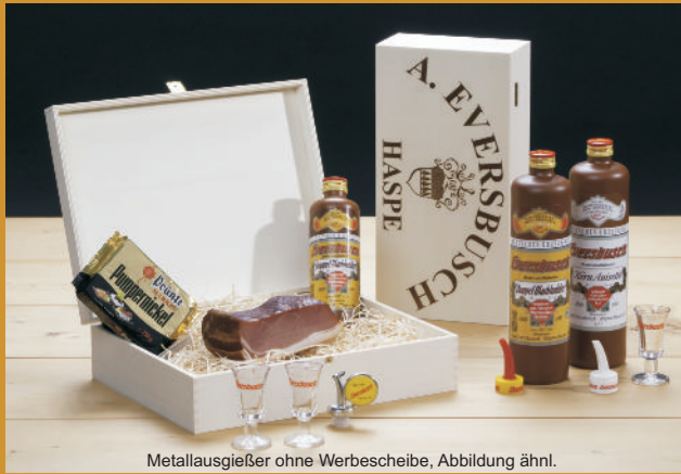
Metallausgießer ohne Werbescheibe, Abbildung ähnl.