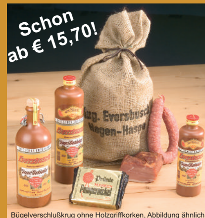
Bügelverschlusskrug ohne Holzgriffkorken, Abbildung ähnlich

traditionelle Erlebnis in geselliger Runde. Auf Wunsch gegen Aufpreis in allen Jutesäcken und Präsentkassetten erhältlich! Artikel Nr. 116 € 8,27